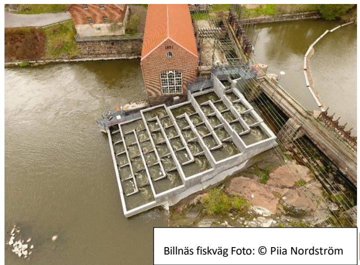
Billnäs fiskväg

Raaseporin kaupunki, joka hyvin aktiivisesti osallistui hankkeeseen, sai keväällä 2017 Aluehallintoviraston luvan rakentaa kalaportaat Åminneforsin ohi ja Billnäsän voimalaitokseen. Kalatalousalue osallistui 25. syyskuuta Billnäsän kalaportaiden harjannostajaisiin. Billnäsän kalaportaat valmistuivat syksyllä 2019 ja Åminneforsin kalaportaat